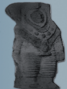
Statue revêtue d'une combinaison. Equateur, BOLIVIE. -3000 Av. J -C.

Cette orientation nouvelle, appelée astro-archéologie, fait du projet Phenix un programme novateur qui complète parfaitement, grâce à une action de terrain, l'édifice déjà solide de la quête de la vie intelligente extraterrestre.