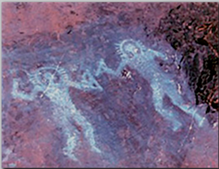
Peintures rupestres, Val Camonica, Italie du Sud. -10000 Av. J. -C

Les recherches officielles du SETI sont basées sur la possible détection d'une émission électromagnétique non naturelle permettant de signaler la présence active d'une civilisation avancée en dehors de notre système solaire.