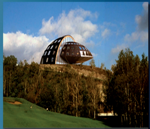
Projection architecturale du siège du Projet Phenix.

Une base de recherche internationale équipée de laboratoires UMR spécialisés (Unité Mixte de Recherche).