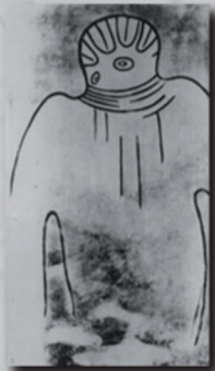
Peintures rupestres d'aborigènes -5000 ans Av. J.-C

Parallèlement à la recherche d'artefacts in situ, le dossier UFO constitue un axe de référence parallèle absolument stratégique autour duquel s'articulent les travaux du projet. Ce dossier est en effet une base de témoignages, d'observations et de données scientifiques hautement crédibles (traces au sol, données radars, physiques, chimiques, spectroscopiques...) permettant une exploitation immédiate sur le terrain aux implications potentiellement stupéfiantes, notamment dans le domaine vital pour notre société humaine : l'énergie !