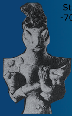
Statuette Sumérienne, Anounakis. -7000 à -12000 Av j.C.