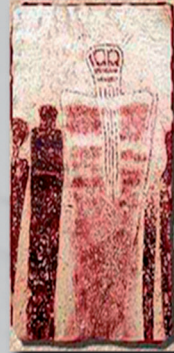
Peintures rupestres d'aborigènes -5000 ans Av. J.-C